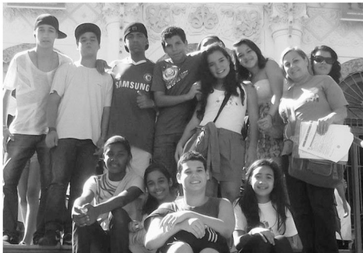
Adolescência Missionária em missão