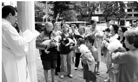
Benção dos animais 4 de outubro dia de São Francisco de Assis

O dizimo nos liberta porque nos cura do egoísmo, da ganância, da avareza. O dizimo nos dá asas para voar porque corta o que nos prende em demasia aos bens materiais, tão passageiros! E ainda, expressa o grau de nosso amor a Deus e à comunidade.!