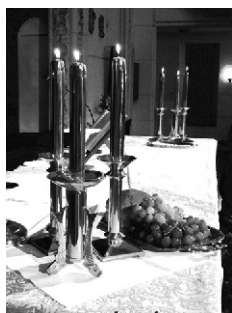
mesa do altar