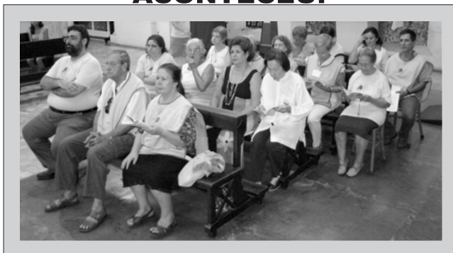
11 de fevereiro - Dia de N. Sra de Lourdes Dia Mundial do Enfermo Missa com participação da Pastoral da Saúde

Adquira a rifa de uma TV LCD - Philips 42" em prol da construção do Centro Comunitário Santo Arnaldo Janssen.