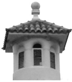
Torre pequena encima do telhado.