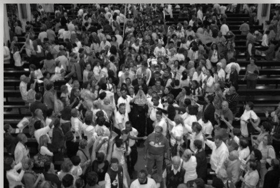
Visita de Nossa Senhora de Nazaré