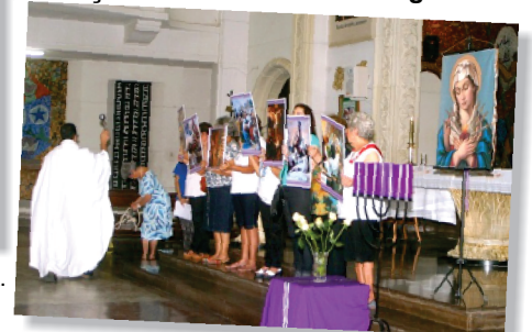
Sete Dores da Virgem Maria

29/03 – quinta-feira - Missa da Ceia do Senhor com Lava Pés