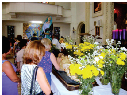
Vigília – Senhor Morto

31/03 – Sábado – Vigília pascal na noite santa