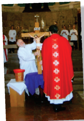
Adoração da Santa Cruz