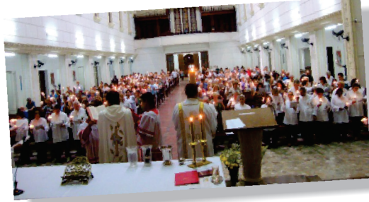
Renovação das promessas do batismo

31/03 – Sábado – Vigília pascal na noite santa