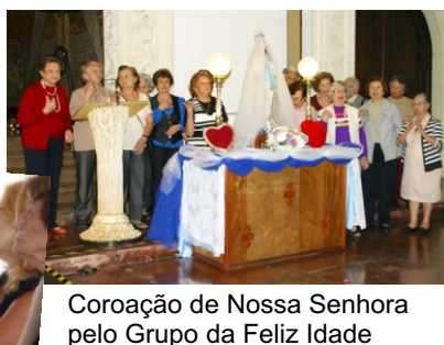
Coroação de Nossa Senhora pelo Grupo da Feliz Idade