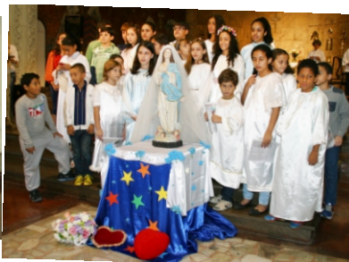
Coroação de Nossa Senhora pela crianças da Cataquese