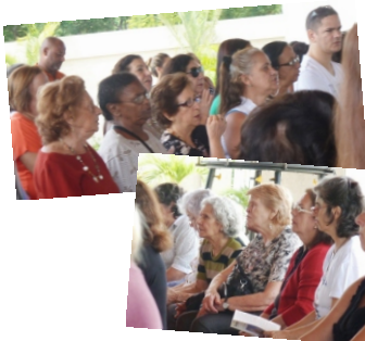
Visita da Terceira Idade ao Santuário de Fátima