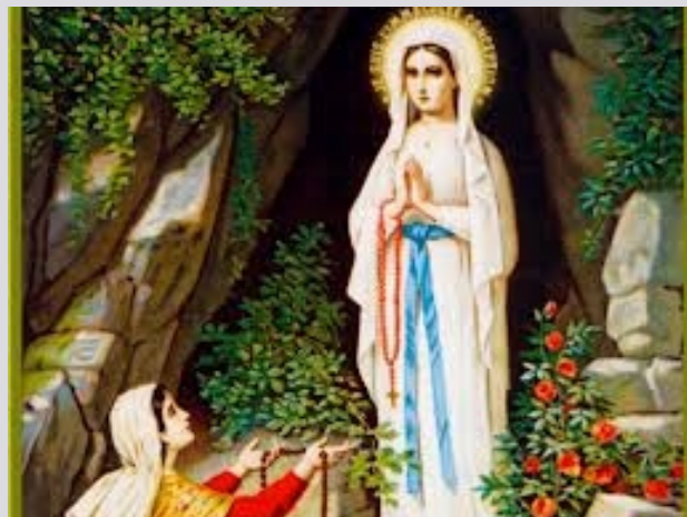
Nsra. de Lourdes

Maria, mãe de Jesus, é "um modelo cristão de ternura e caridade respeitosa para com o sofrimento dos doentes": sublinha o Papa Francisco na mensagem destinada ao Dia Mundial do Doente, que é celebrado anualmente pela Igreja Católica na festa litúrgica de Nossa Senhora de Lourdes, 11 de fevereiro, que assinala as aparições a Bernadette Soubirous, em 1858, as quais levaram a um movimento de oração e caridade com atenção particular aos que estavam em situação de enfermidade.