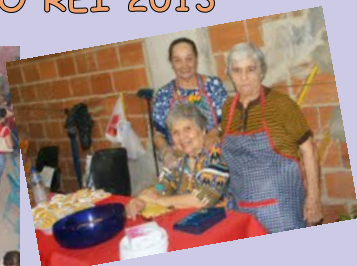
Unção dos Enfermos