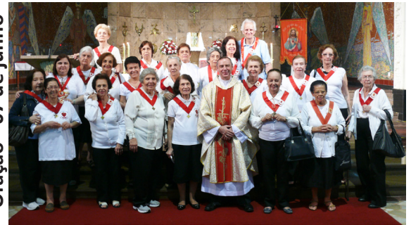
Missa do Apostolado da Oração - 07 de junho