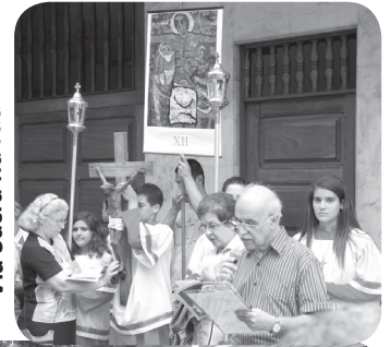
Via Sacra na rua