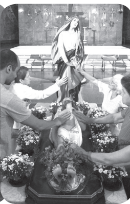
Sexta-Feira da Paixão do Senhor