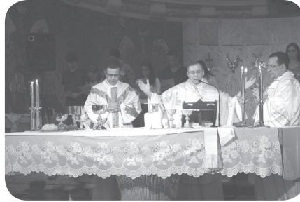
Missa da Ceia do Senhor