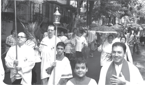
Domingo de Ramos - Procissão