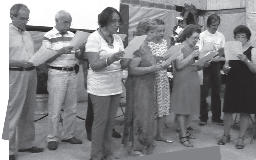
Festa das Pastorais 07 de dezembro