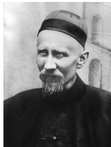
São José Freinademetz 29 de Janeiro