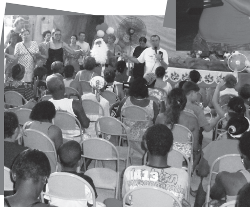
Natal dos Vicentinos 08 de dezembro