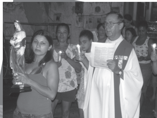
Missa na Comunidade Santa Luzia no dia da padroeira 13 de dezembro